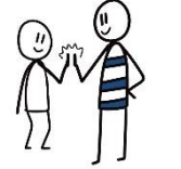
Een high five of box geven