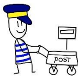
Een brief schrijven