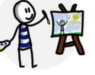
Een tekening maken