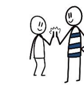
Een high five of box geven