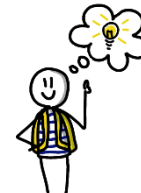
Ik heb een ander idee...