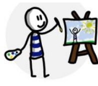
Een tekening maken