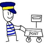
Een brief schrijven