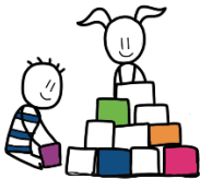
Iets samen doen