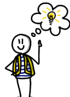
Ik heb een ander idee...