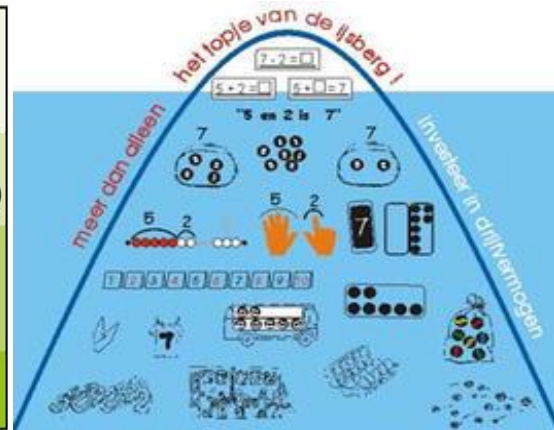
Figuur 2, ijsbergmodel

In de eerste twee fasen gaat het om (handelend) rekenen in concrete situaties. Dit is de onderste en basale fase in het handelingsmodel en geldt als voorwaarde voor het handelen en functioneren op de twee hoogste niveaus. In de fasen erna worden kennis en effectieve strategieën (met behulp van denkmodellen) vanuit de concrete situatie geabstraheerd en geautomatiseerd zodat ze herkend worden en leerlingen uiteindelijk een rekenbewerking op formeel niveau kunnen uitvoeren.