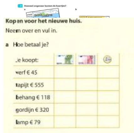
Figuur 6, handelingsniveau 3: voorstellen – abstract

De feitelijke handeling (niveau 1) of de herkenbare weergave (niveau 2) van betalen wordt vertaald in een meer abstracte notatie (een tabel), die vervolgens vervangen wordt door de formele notaties + of x. Voor veel leerlingen is het invullen van een tabel erg abstract. Als de leerling dit niet begrijpt is het noodzakelijk terug te gaan naar de vorige handelingsniveaus en bijvoorbeeld dit schema te ondersteunen met ‘echt’ geld en steeds aandacht te blijven schenken aan de relatie tussen het geld en het turven in het schema. Het begrijpen van deze denkmodellen werkt ondersteunend voor de bewerkingen op het hoogste niveau.