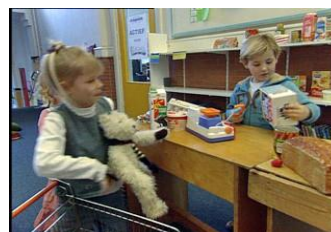
Figuur 4, handelingsniveau 1: 'Informeel handelen'

Als je wilt werken aan de begripsvorming dan is het zaak om te starten met de eerste fase, 'informeel handelen in werkelijkheidssituaties': handelend rekenen in concrete situaties. Het mooiste is als leerlingen in de praktijk ervaringen met betalen opdoen of in situaties die de praktijk zoveel mogelijk benaderen. Een bezoek aan een echte winkel of het inrichten van een winkel op school zijn daar voorbeelden van. Een voorbeeld van informeel handelen bij de leerlijn Geld is 'Winkeltje spelen' in de klas. Eén persoon is de cassière en leerlingen mogen spulletjes bij de cassiere kopen en afrekenen. De begrippen 'kopen'/'afrekenen', 'hoeveel is dat samen'/'betalen' etc. komen op die manier aan de orde. Voor de leerlingen wordt het heel visueel wat er gebeurt als je iets koopt. Het is belangrijk dat de leerlingen vertellen wat er gebeurt in de winkel. Op die manier leren zij de begrippen hanteren en te koppelen aan de handeling. Ook bijvoorbeeld het oefenen met de opbouw van getallen kan door middel van namaakgeld. Leerling krijgen de opdracht om bedragen samen te stellen met geld of om bijvoorbeeld bedragen op verschillende manieren neer te leggen, zoals een briefje van 10 euro is evenveel als 5 losse munten van 2 euro.