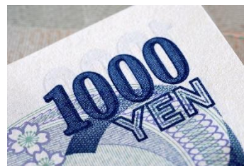
Euro, Britse pond & Japanse Yen