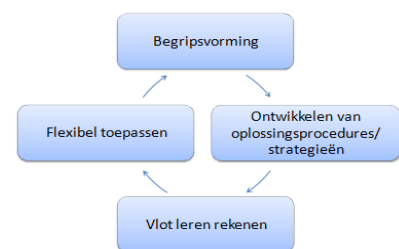
Figuur 3, Het hoofdlijnenmodel