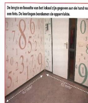
Figuur 5, Handelingsniveau 2: voorstellen

Als de leerlingen er aan toe zijn, ga je door naar de volgende fase ‘Voorstellen – concreet’. Aan de hand van foto’s of tekeningen moeten de leerlingen zich een voorstelling maken van de situatie. In het voorbeeld van de oppervlakte bepalen, moeten de leerlingen een relatie leggen tussen de afbeelding van een lokaal en de bijbehorende maten en het lokaal dat ze eerder zelf hebben opgemeten (figuur 5). Doordat de handeling die centraal stond in het spel is weggelaten, kan het voor sommige leerlingen nog even onduidelijk zijn wat de bedoeling is van de opgave. Maar voor de meeste leerlingen zal het wel duidelijk zijn.