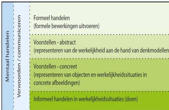
Figuur 1, handelingsmodel (Bron: Groenestijn, Borghouts & Janssen, 2011)

De rekenontwikkeling verloopt in vier fasen. Dit wordt weergegeven in het handelingsmodel (figuur 1). Het ijsbergmodel (figuur 2) geeft een visuele uitwerking van het handelingsmodel, aan de oppervlakte zien we de bewerkingen (formele sommen) en onder de oppervlakte zien we de begrippen en procedures die ze nodig hebben om deze bewerkingen uit te kunnen voeren.